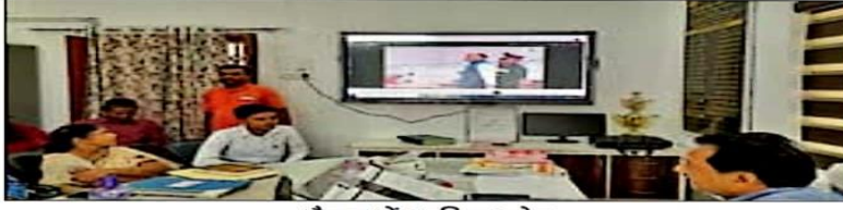
बैठक में शामिल लोग